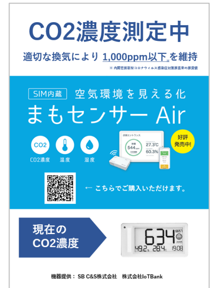
ポスター掲出状況